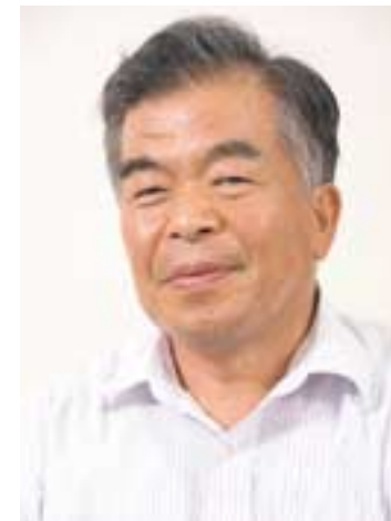
にしこおり・こうじ profile

ることで、ウイルスの侵入をかなり防げるはず。これからの季節、銀を上手に活用してインフルエンザの大流行に備えましょう。